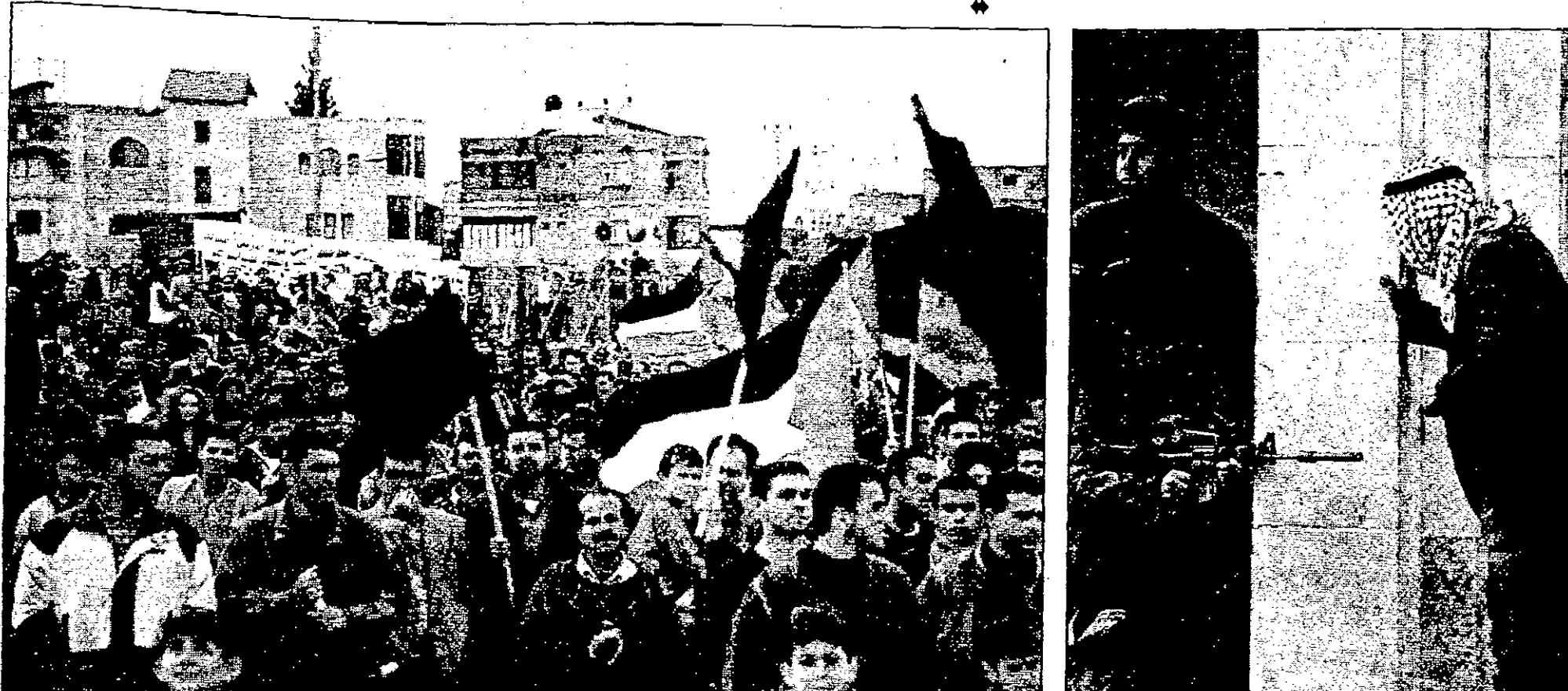
الاحتفال في القدس بمرور 22 عاماً على احتلال الضفة والقطاع، يشارك فيه عشرات الآلاف من المواطنين، بينهم أطفال، يحملون الأعلام الإسرائيلية ويغنون نشيد "الارض" الذي كتبته نازك العياشي.